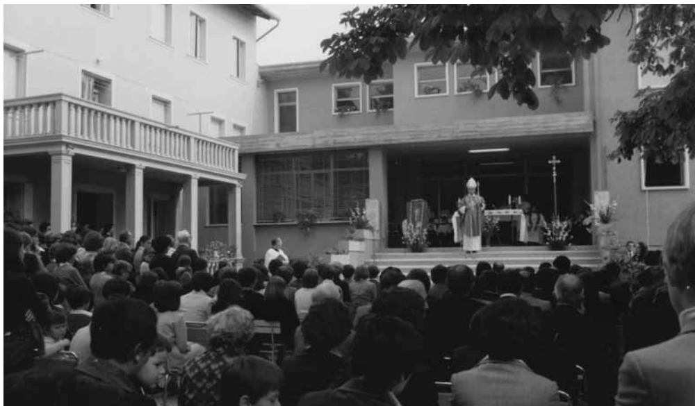
Il Vescovo celebra la Cresima nel cortile della scuola materna, dopo il terremoto del 1976

Nel 1977 muore l'affezionatissimo Vescovo Vittorio De Zanche e gli succede definitivamente Abramo Freschi. Dopo aver partecipato alla liturgia «così come la si vive a Porcia», il nuovo Vescovo prega don Felice di assumere nuovamente la presidenza della Commissione liturgica diocesana, incarico da cui era stato sollevato cinque anni prima, quando la difficoltà di coniugare il lavoro in parrocchia