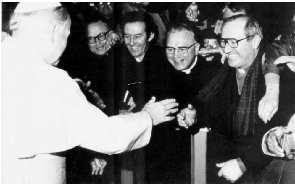
A Roma, l'incontro con Giovanni Paolo II