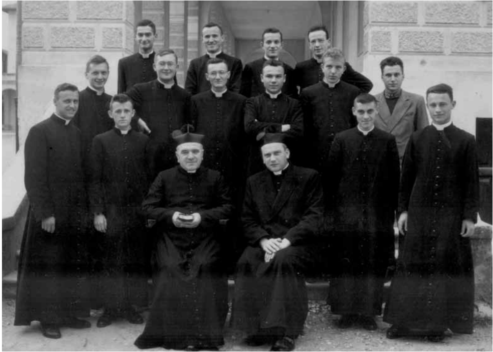
In Seminario con i compagni di studio e i docenti del corso filosofico

che arriva a noi. Oratio , la comprensione dell'effetto sulla propria vita, sul proprio modo di pensare, di vivere e di agire. Contemplatio , la composizione del tutto, il momento dell'estasi, del sogno, della poesia e della commozione, dove commozione non è tanto la semplice emozione, ma il mettersi in movimento insieme». L'adolescenza passa nell'obbedienza, tra le fatiche dello studio, la vita comune e le mortificazioni che il Seminario richiede, ma non scalfiscono la determinazione dell'aspirante prete: «Anche nei momenti critici dell'età della transizione (che ho avvertito e come!), forse una volta sola ho pensato di cambiar strada, ma è stato un pensiero fugace, quasi non avvertito».