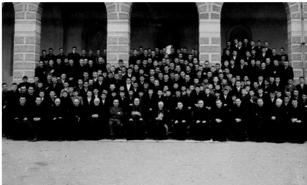
Foto di gruppo al Seminario di Pordenone nel 1956