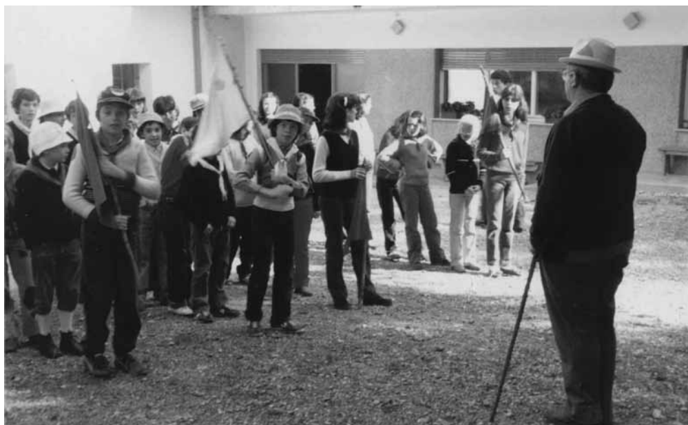
Formazione delle squadriglie durante un campo di Fusine

Durante il campo estivo o invernale, la giornata viene scandita da un programma molto serrato, accuratamente preparato nelle settimane precedenti dal gruppo degli animatori. Anche in questo caso nessun particolare è lasciato al caso, perché proprio dai segni e dai simboli più semplici, il più delle volte, nascono le forti