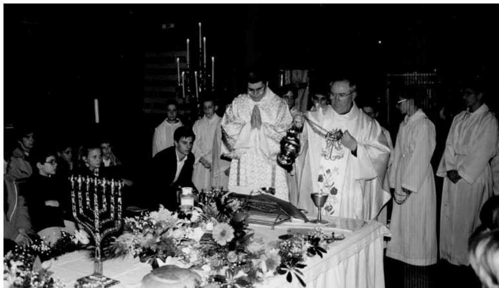
Un momento della celebrazione della messa "in Coena Domini", il giorno di Giovedì Santo del 2000