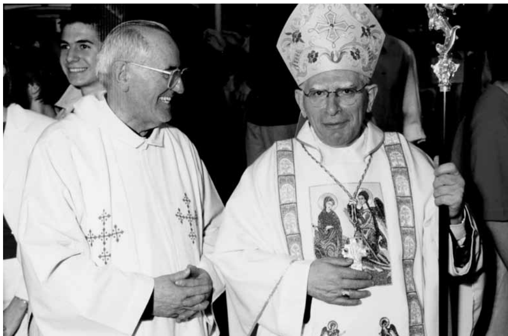
Con il Vescovo Ovidio Poletto

nella celebrazione di questa domenica vi stringete attorno a Mons. Felice, con particolare affetto, per ringraziarlo del suo instancabile ministero sacerdotale, con cui per oltre 23 anni è stato vostro Parroco. La sua opera è stata un dono grande del Signore per tutti e soprattutto per numerosissimi giovani. Sotto la sua guida la Parrocchia di S. Giorgio – come voi avete constatato – è diventata "il cuore" della Città di Pordenone. Anch'io desidero unirmi a voi e manifestare la stima e gratitudine mie personali e della Diocesi a mons. Felice. Con l'auspicio che possa mettere ancora a frutto del cammino pastorale della nostra Chiesa tutte le sue energie ed esperienze.