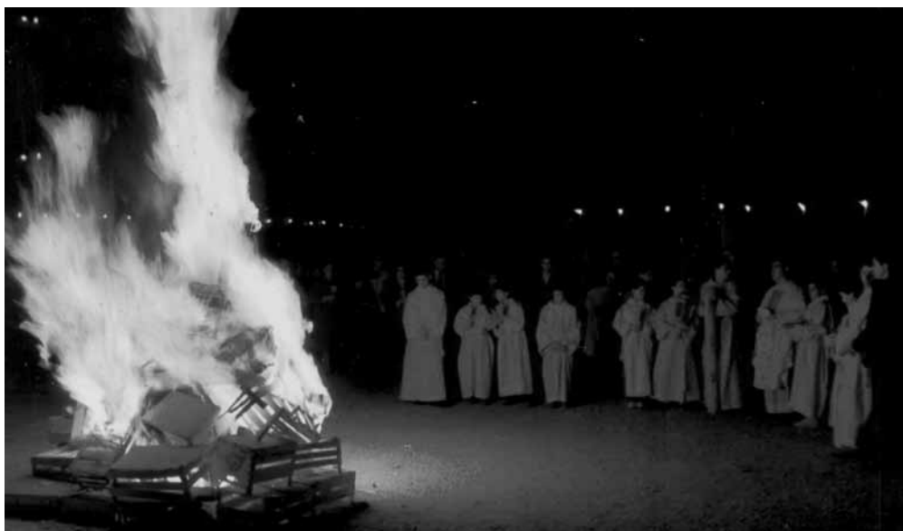
All'esterno della chiesa si prepara il falò che darà avvio alla liturgia della luce che aprirà la Veglia della notte di Pasqua