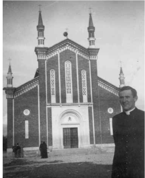
Durante il liceo, con la tonaca, davanti alla prima chiesa parrocchiale di Gleris