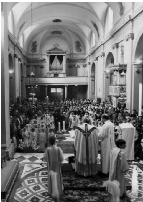
La chiesa di San Giorgio gremita in occasione della Prima Comunione del 1980