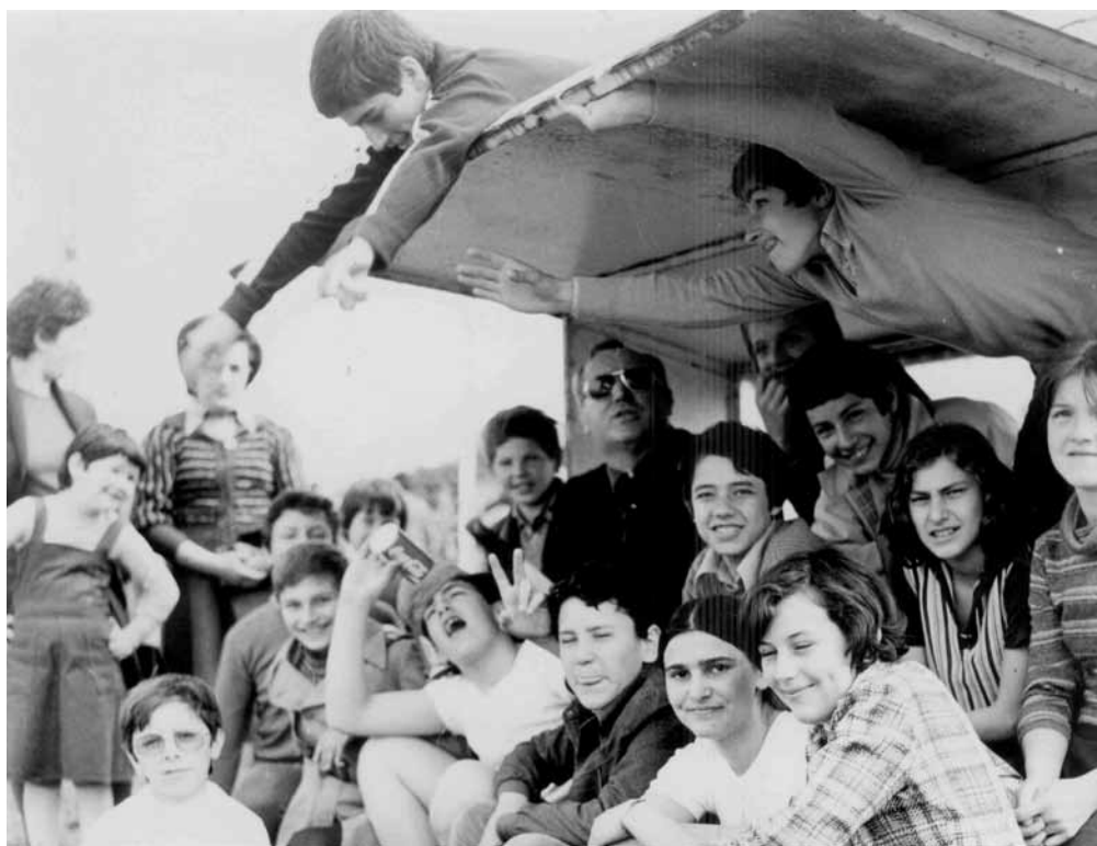
Circondato dai ragazzi, durante una partita della Polisportiva San Giorgio di Porcia