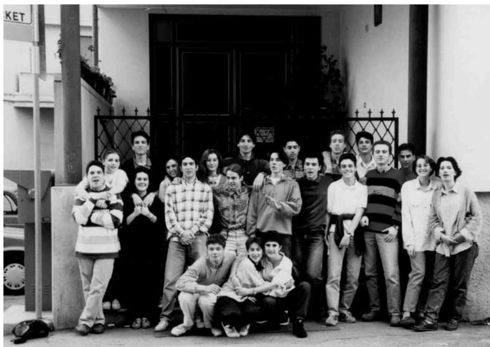
Un gruppo di giovani davanti all'ingresso dell'oratorio San Giorgio