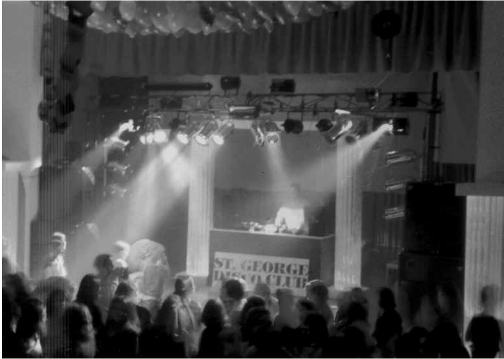
Una festa da ballo nell'auditorium dell'oratorio San Giorgio, nell'ambito dei Sabati insieme

Diciamo, invece, che la parrocchia, l'oratorio e la scuola cattolica tanto per trasferirsi in un altro settore, a noi pare che non abbiano prodotto dei complessati, anzi. Quando l'individuo ha ricevuto una solida formazione riesce a inserirsi molto bene nella società con un vantaggio in più, quello di scegliere il meglio per sé. Guardando le frotte di ragazzini, agghindati in un certo modo, che corrono verso le discoteche, ci chiediamo: i loro genitori sanno dove si recano, con chi vanno e cosa fanno? Non entriamo nel merito di queste scelte proprio per non turbare l'armoniosa crescita di quei giovani; tanto meno vorremmo creare in essi dei complessi di inferiorità. Facciamo solo delle osservazioni da cronista. Noi, per i nostri ragazzi, preferiamo gli oratori come luogo di divertimento, di svago, di incontro e di formazione. Il domani resta nelle mani dei ragazzi, presto futuri uomini.