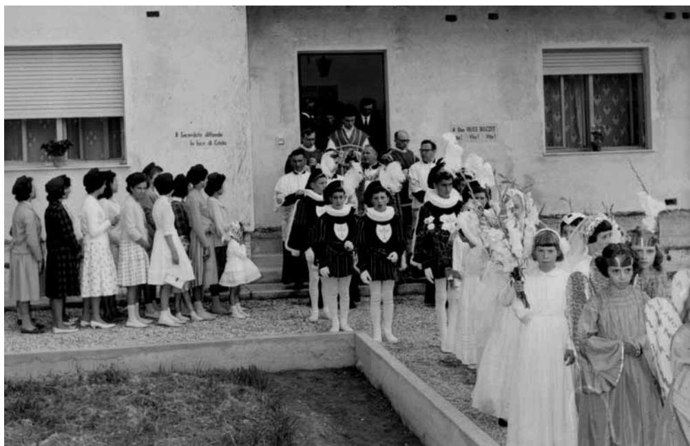
La sfilata che accompagna l'ingresso del neo-sacerdote nella chiesa di Gleris per la celebrazione della prima messa