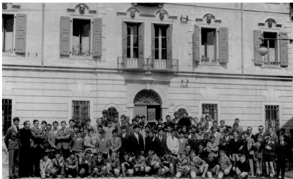
Foto di gruppo davanti alla Casa della Gioventù di San Vito al Tagliamento

qualunque scelta fosse stata fatta. Se così fosse, considerati gli anni a cui ci stiamo riferendo, almeno per la realtà di San Vito, vorrebbe dire che don Felice aveva capito molte cose. E le aveva capite prima delle aperture del Concilio.