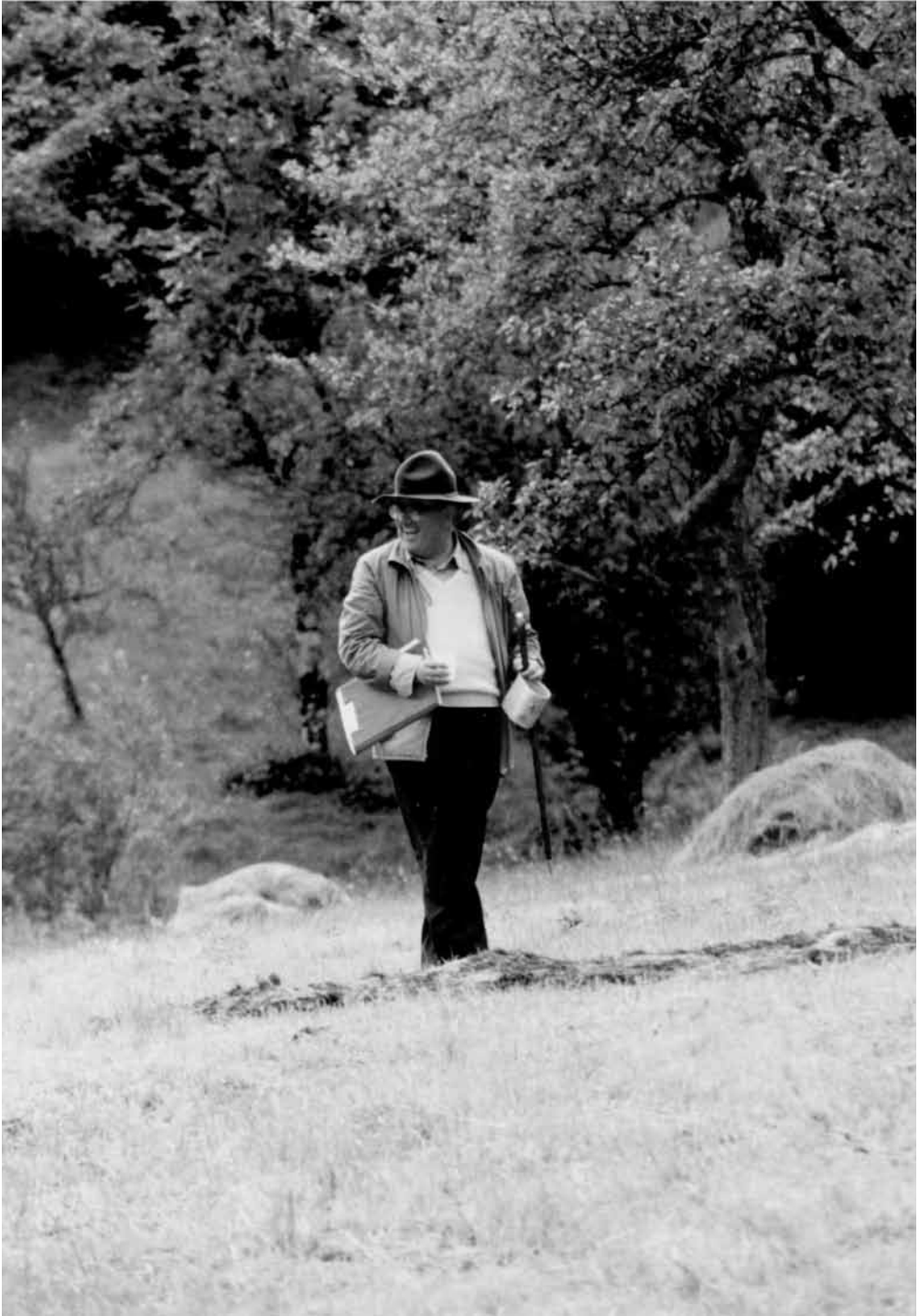
Con berretto, bastone e l'inseparabile cartellina di appunti, durante un'escursione