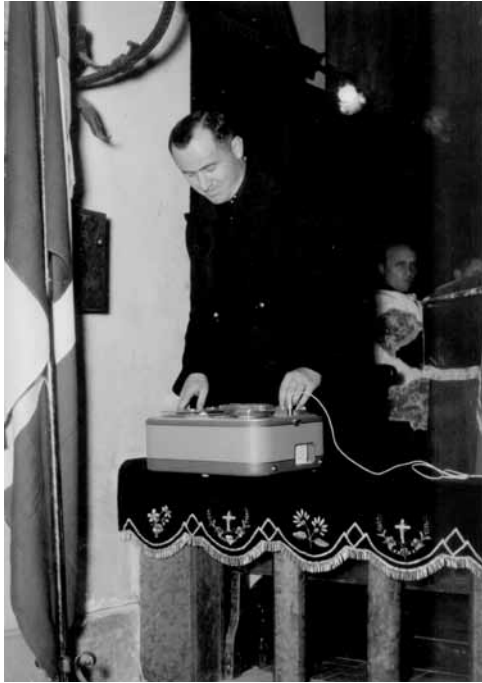
Alle prese con la tecnologia dell'epoca

erano scienze che si andavano studiando insieme, giorno per giorno. Era bellissimo vedere ravvivarsi l'attenzione dei ragazzi tutte le volte che riuscivi a umanizzare le cose di cui stavi parlando».