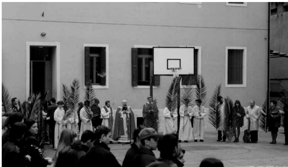
L'inizio della processione della Domenica delle Palme, nel cortile dell'Istituto San Giorgio