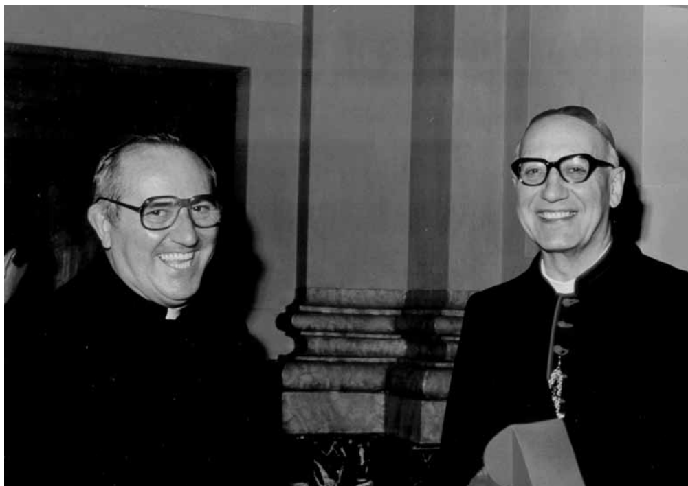
Con il Vescovo Abramo Freschi nella chiesa di San Giorgio