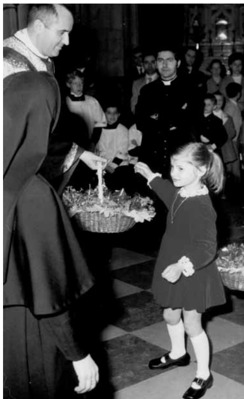
Durante la messa inaugurale a Porcia