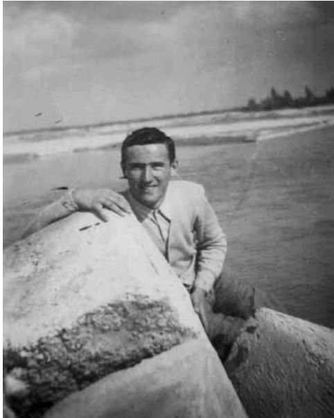
Sulla riva del Tagliamento, nei primi anni '50