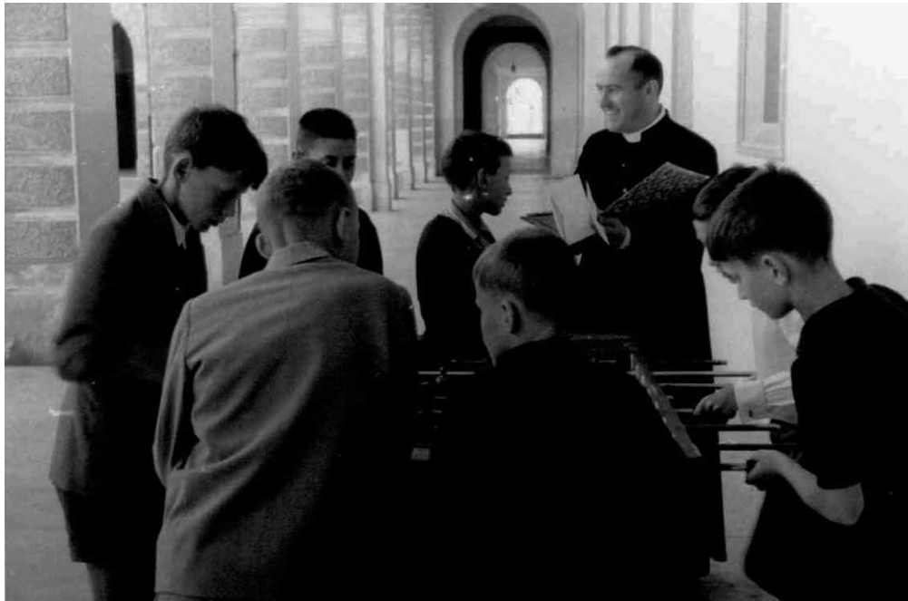
Un momento di incontro coi giovani che frequentano i corsi di orientamento in Seminario